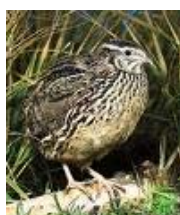
Prepelica - ni ja se ne volim pokazivati