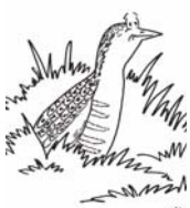
Kosac - samo da mi se sakriti...