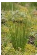
Sit - mene stoka zaobilazi, pogodi zašto!