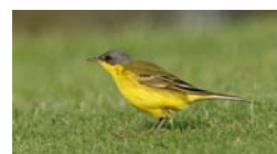
Žuta pastirica - oko stoke uvijek puno kukaca. Njam!