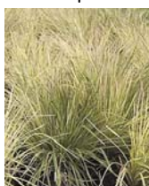
Busika - narastem i do 1,5 m