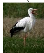
Roda - hm...bolje vidim voluharicu u niskoj travi